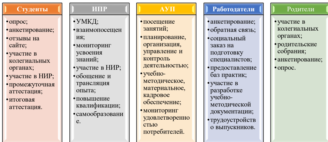
Рисунок 2.1 Участие в реализации Политики обеспечения качества всех заинтересованных сторон

В формировании и поддержке Политики обеспечения качества образовательной программы определены компетенции заинтересованных сторон: