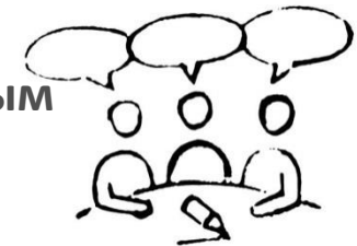
Стол и тема 5